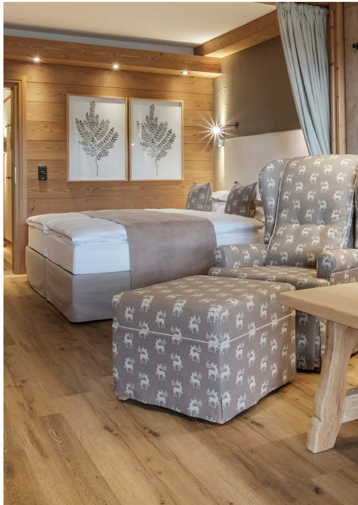
Machen Sie Schlafkomfort zum Markenzeichen Ihrer Architektur. Make superior sleep comfort the hallmark of your architecture.

Ob Boutiquehotel, Longstay-Konzept oder anspruchsvolles Objekt: Mit der Hotel- und Objektkollektion von SCHRAMM verankern Sie das Thema Schlaf als zentrales Qualitätsmerkmal Ihres Projekts - und schaffen für Ihre Auftraggeberinnen oder sich selbst einen ebenso ästhetischen wie wirtschaftlich nachhaltigen Mehrwert.