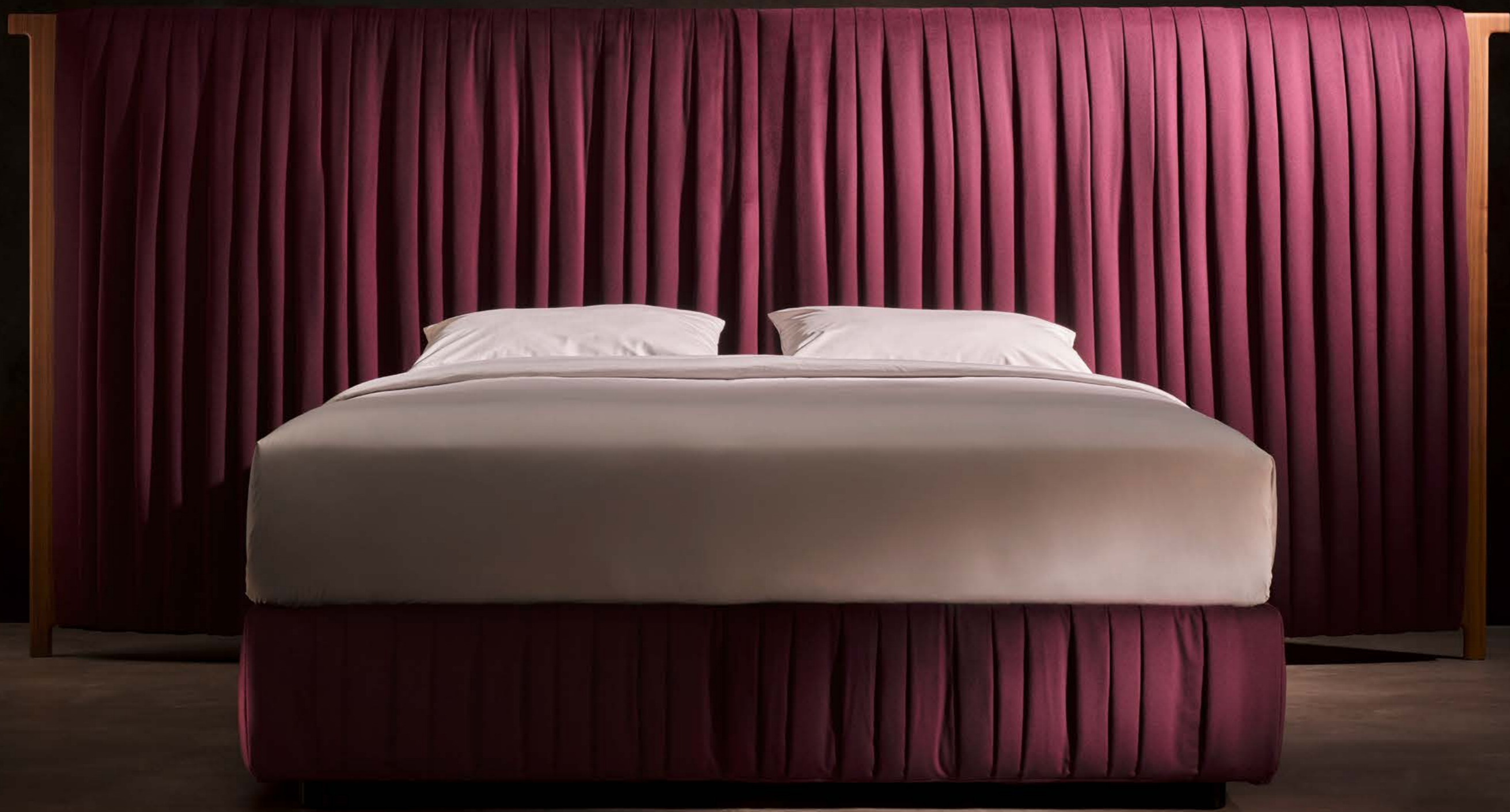
Grand Cru Sipario