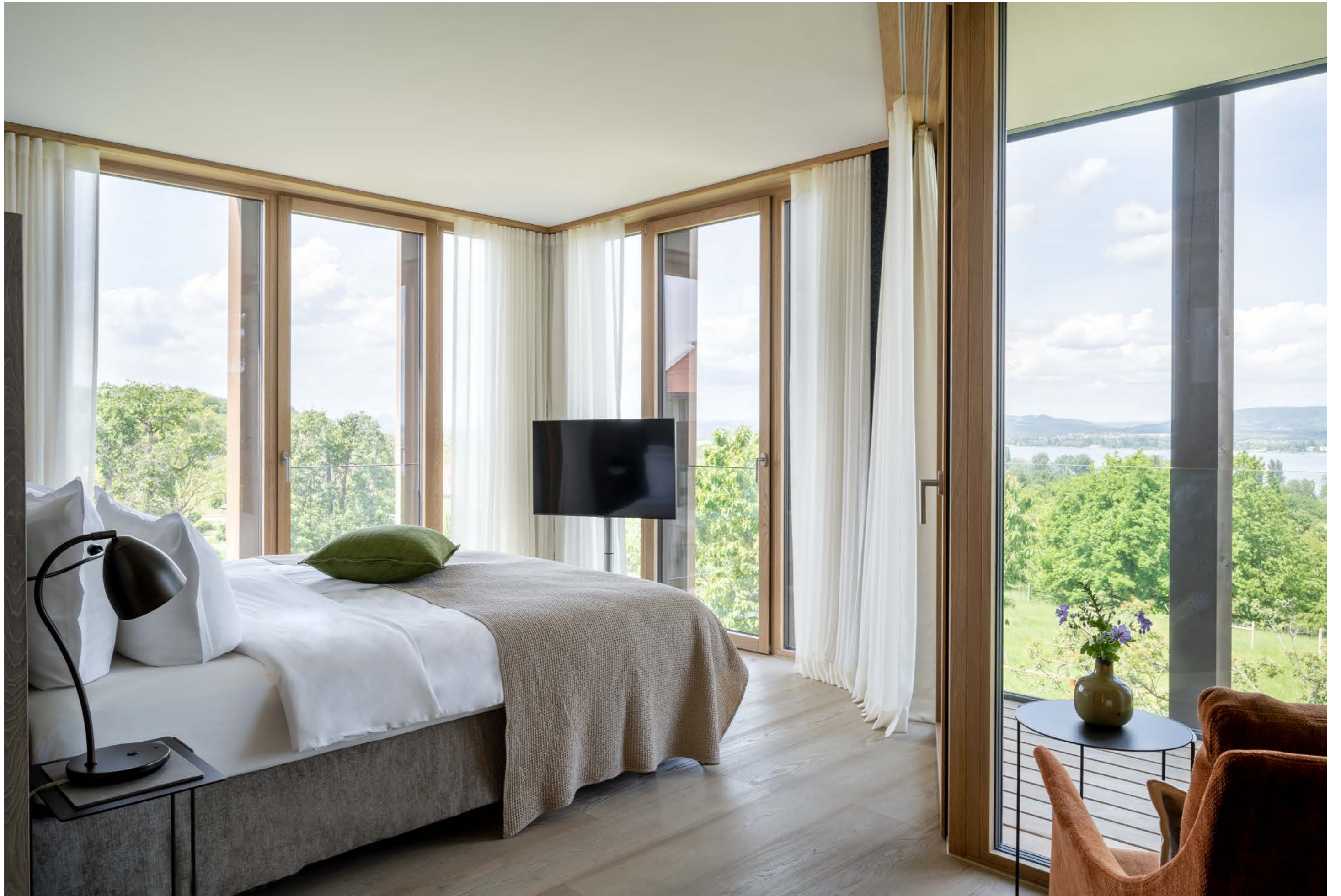
Hotel HIRSCHEN HORN