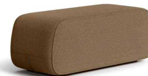
Lysander - Bank - Bench