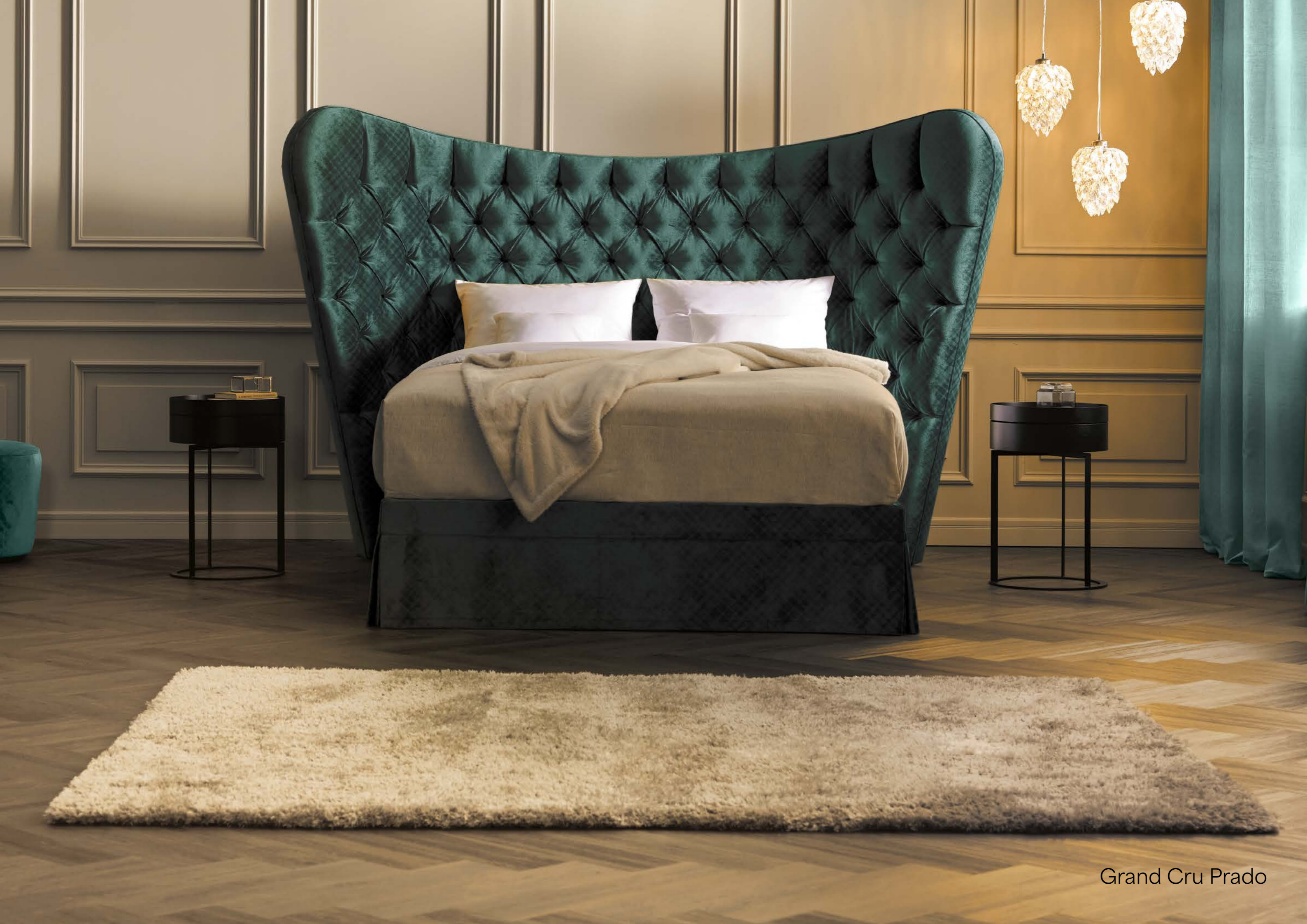
Grand Cru Prado