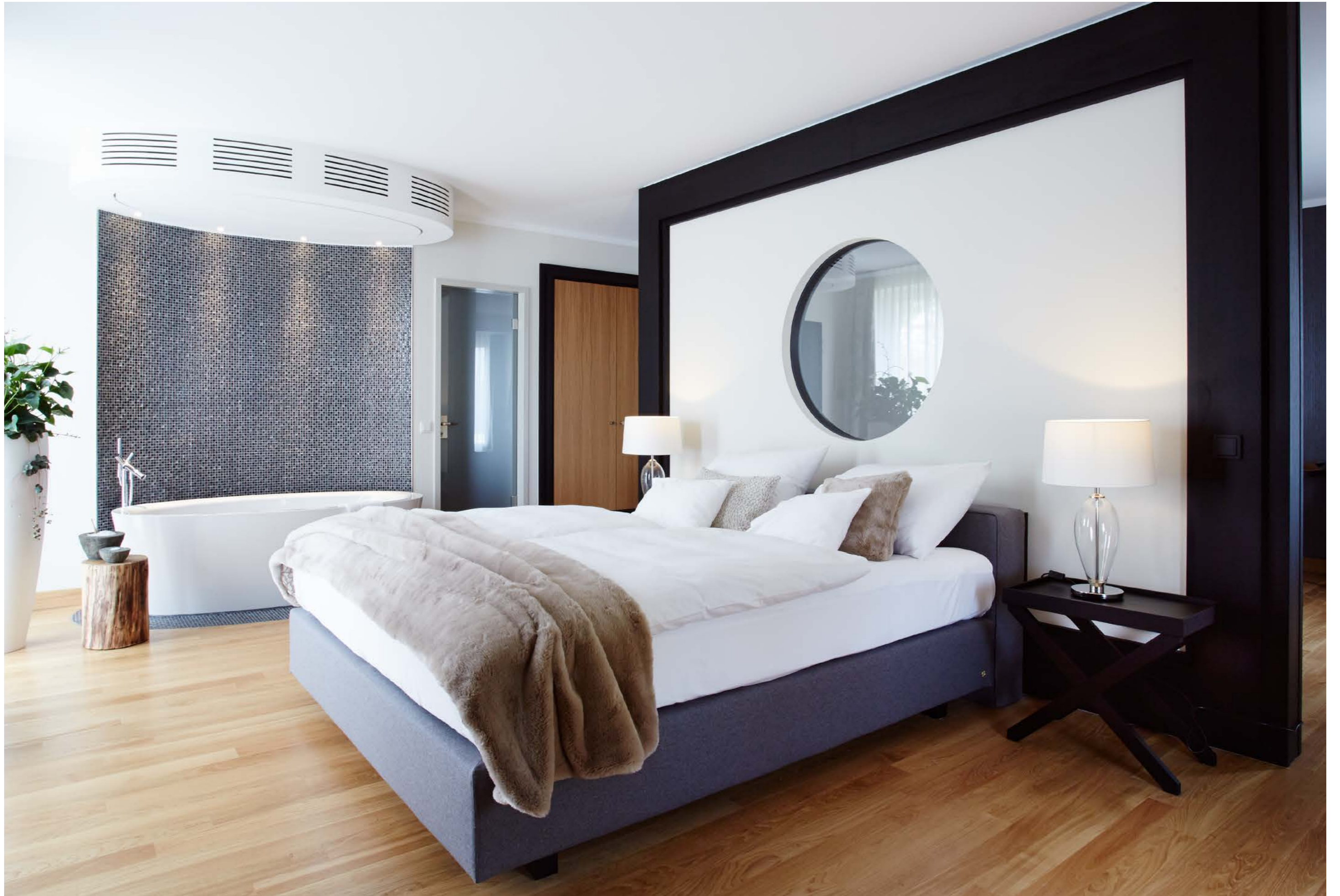
Hotel Hof Grothues-Potthoff