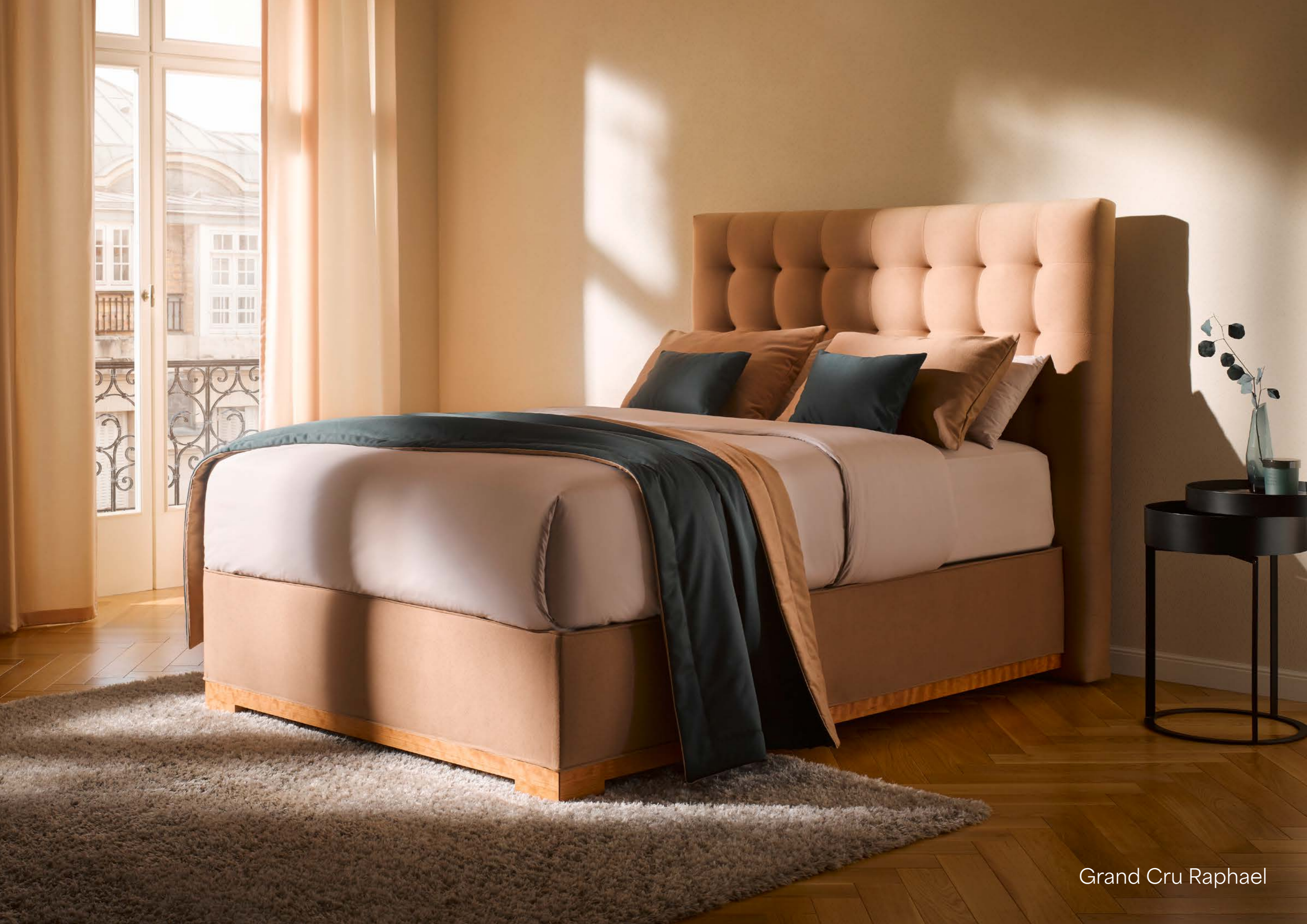
Grand Cru Raphael