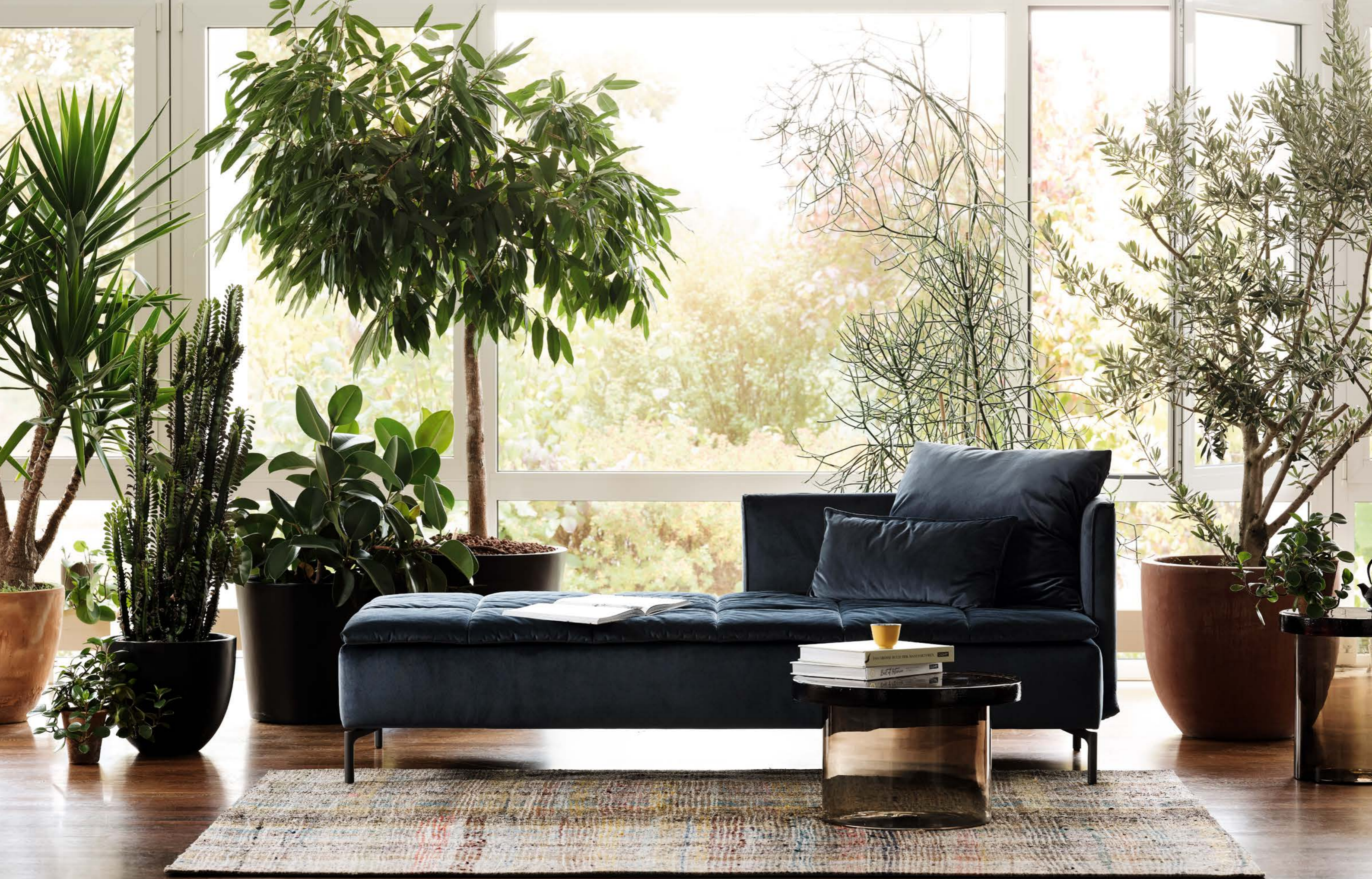
Origins Complete Daybed Remy