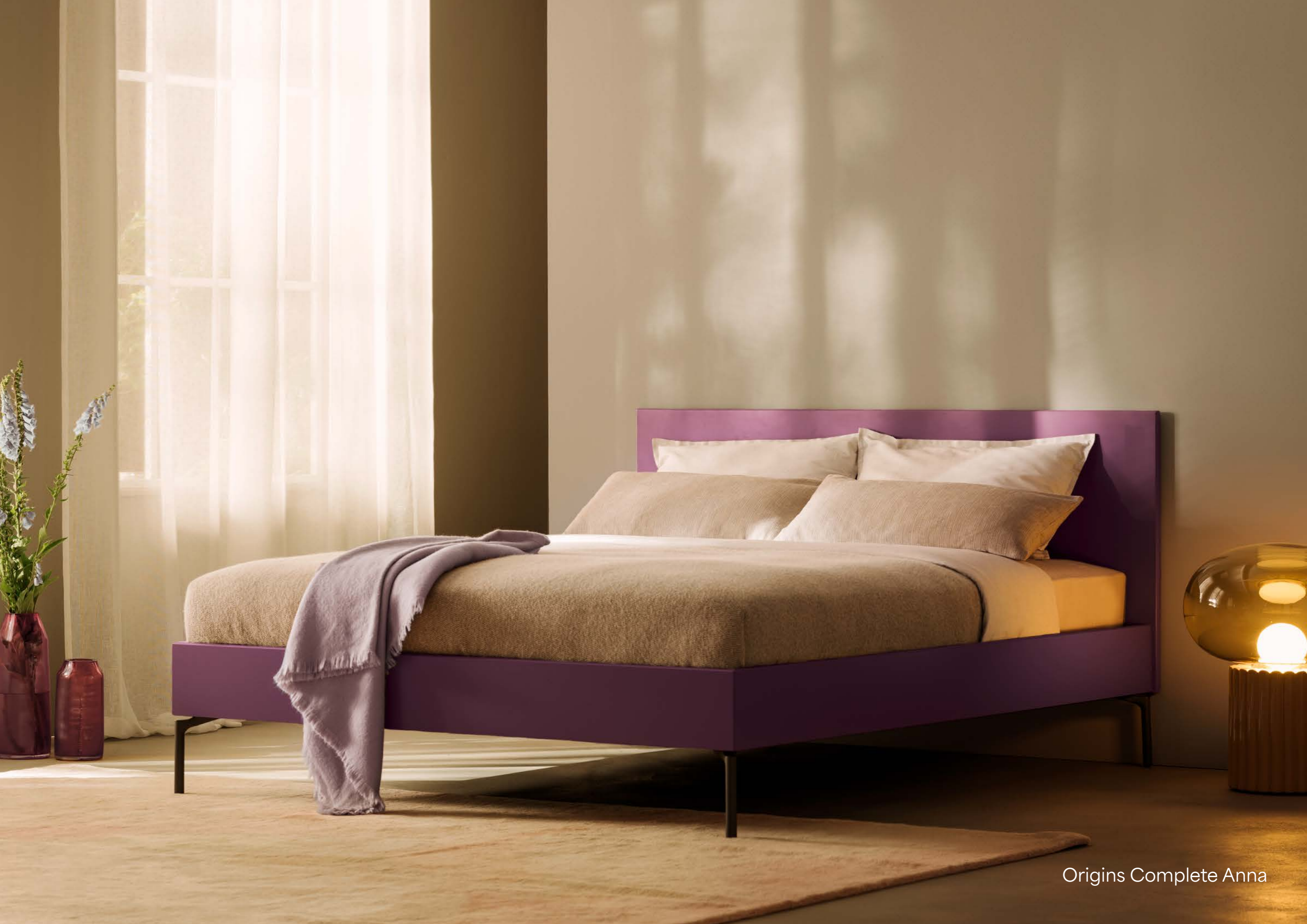
Origins Complete Anna