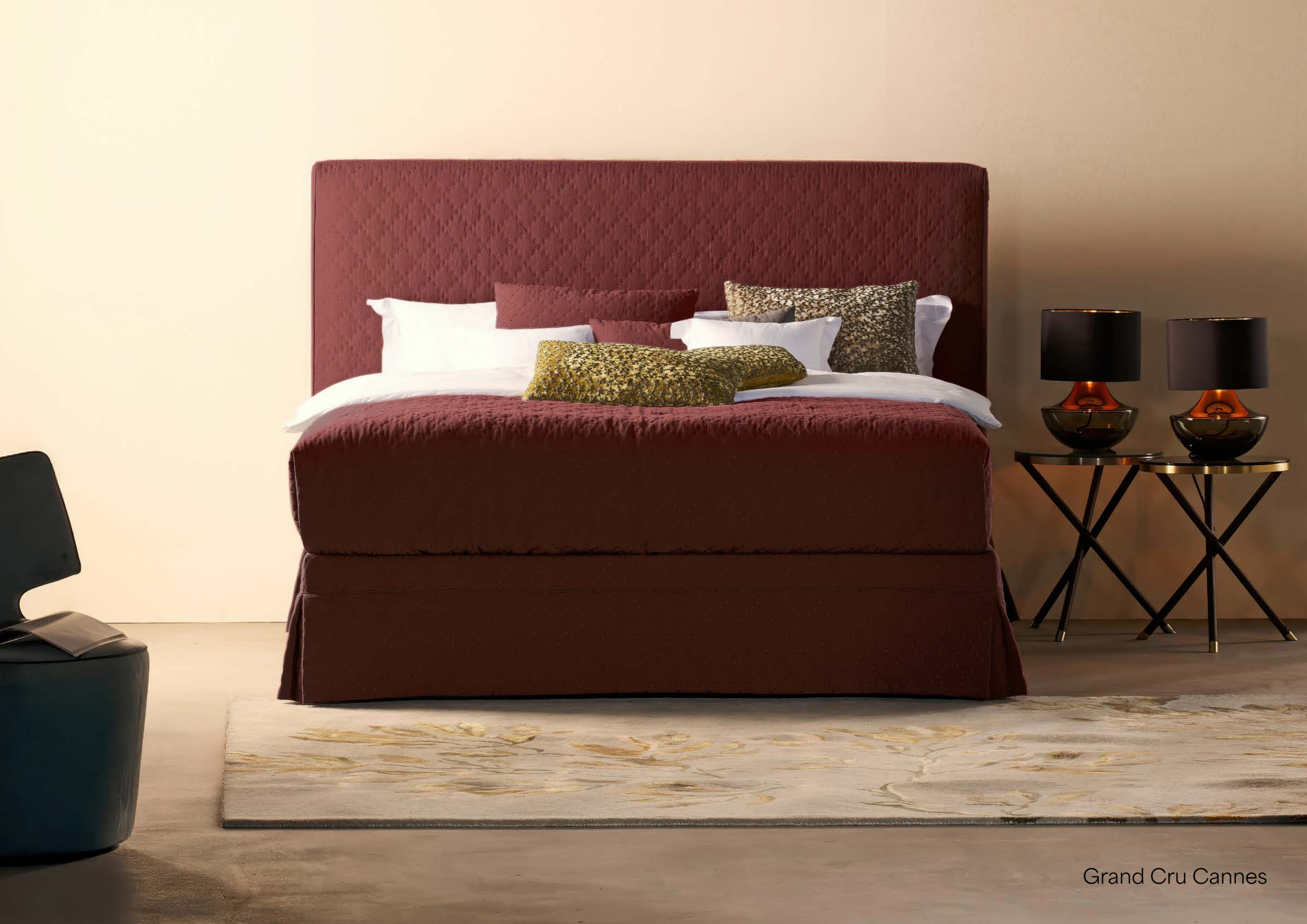
Grand Cru Cannes