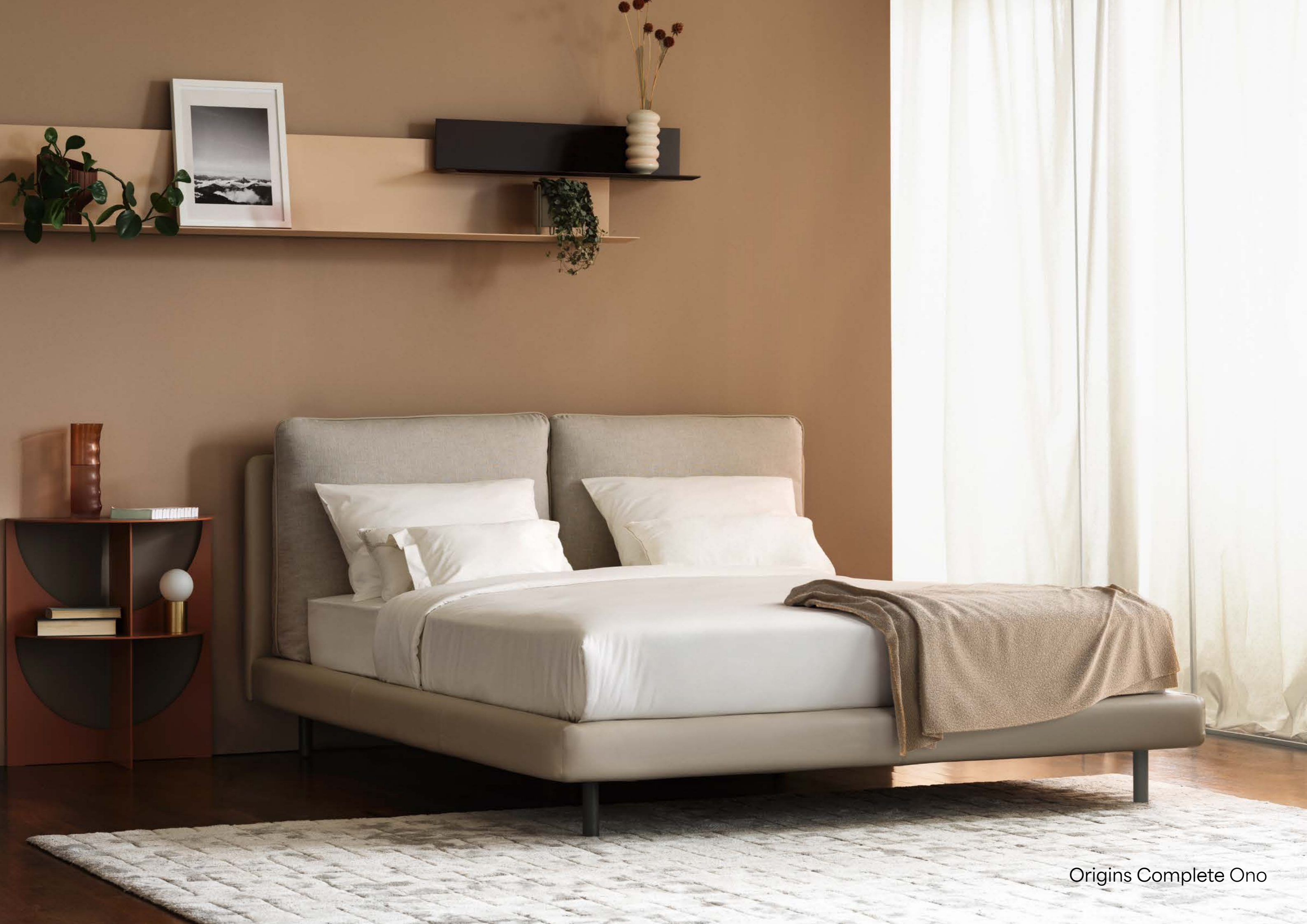
Origins Complete Ono