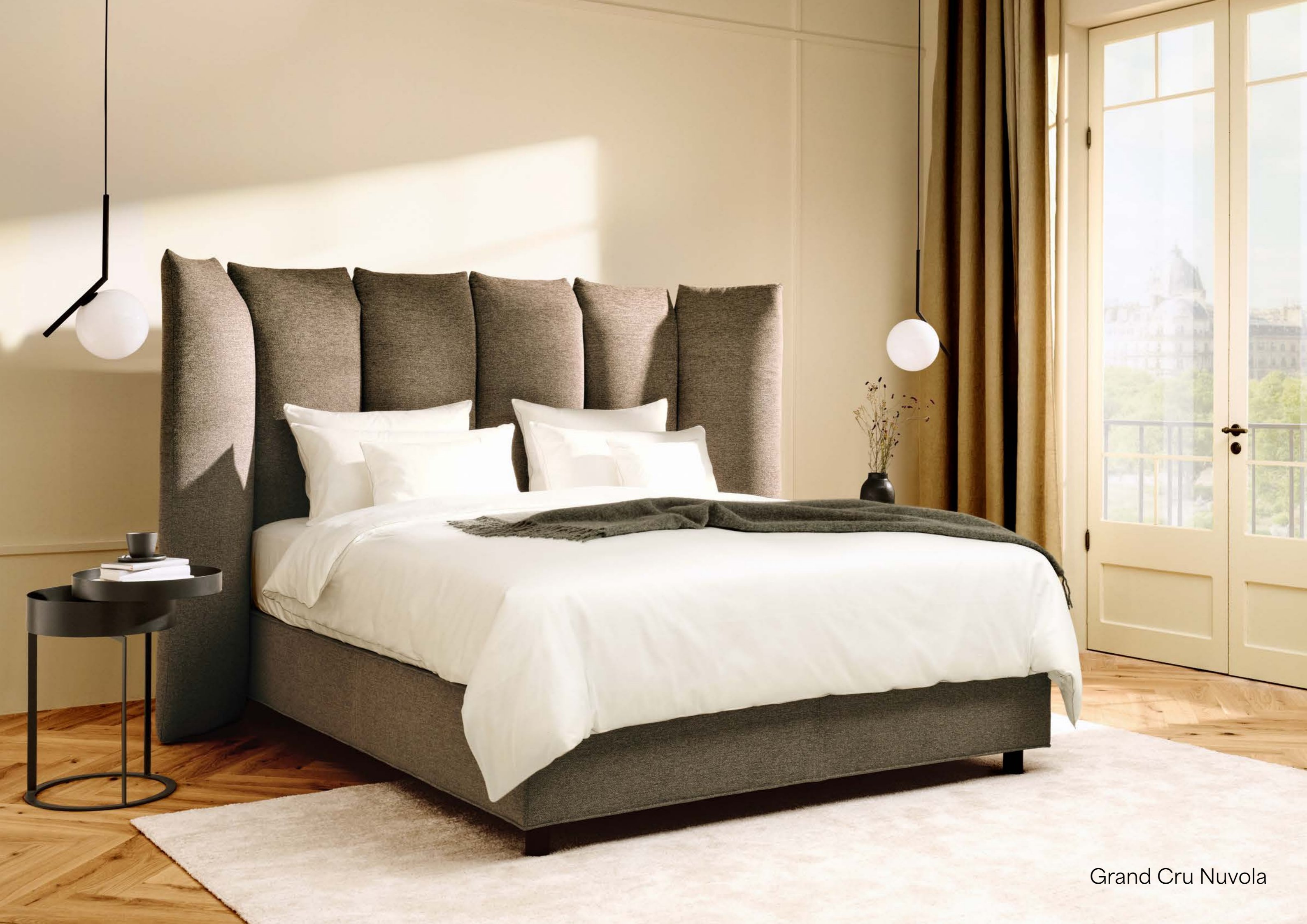
Grand Cru Nuvola