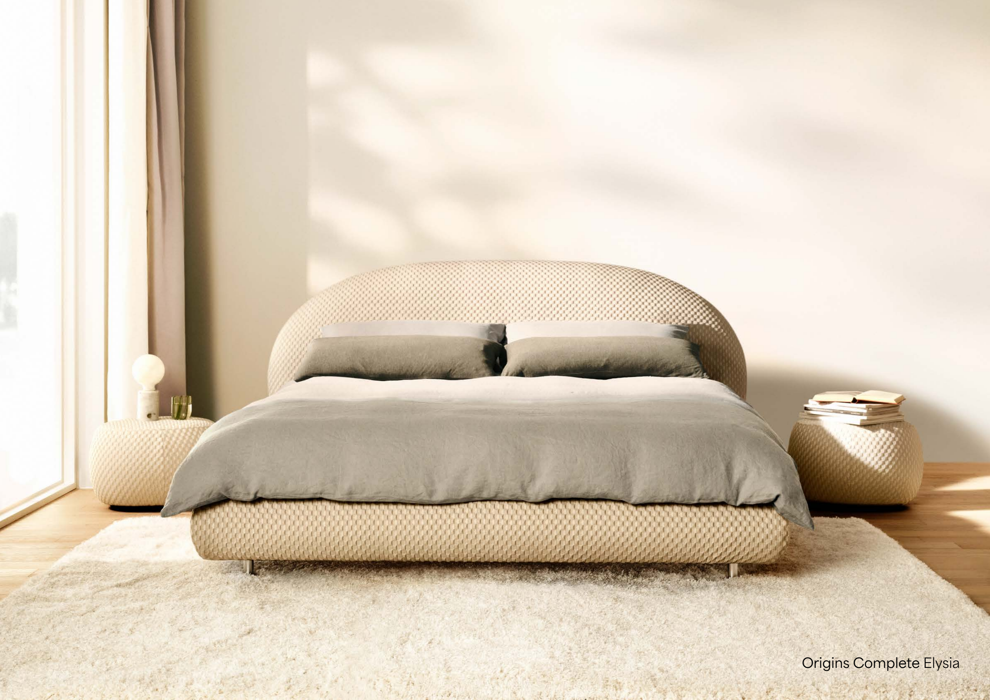
Origins Complete Elysia