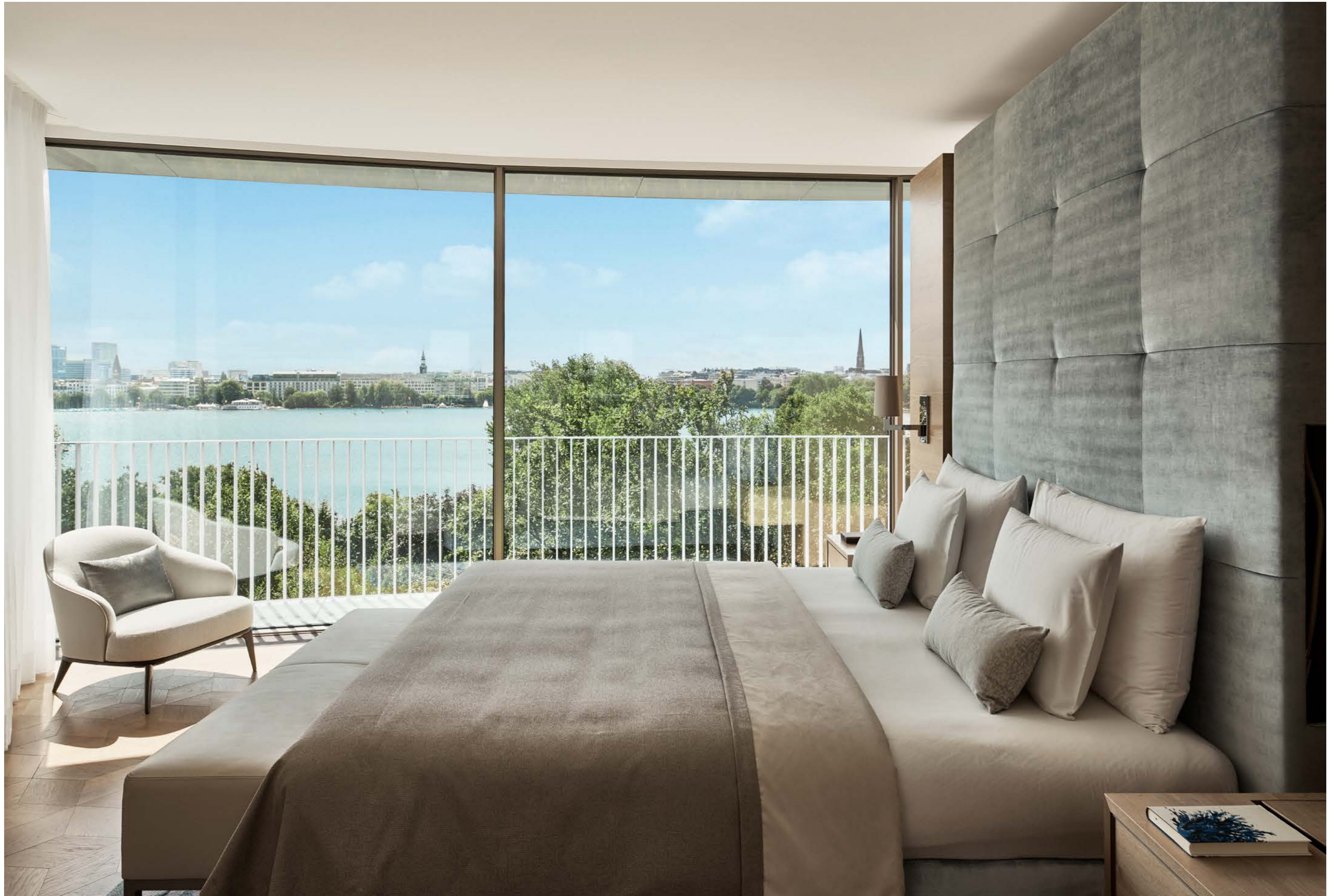
THE FONTENAY Hamburg