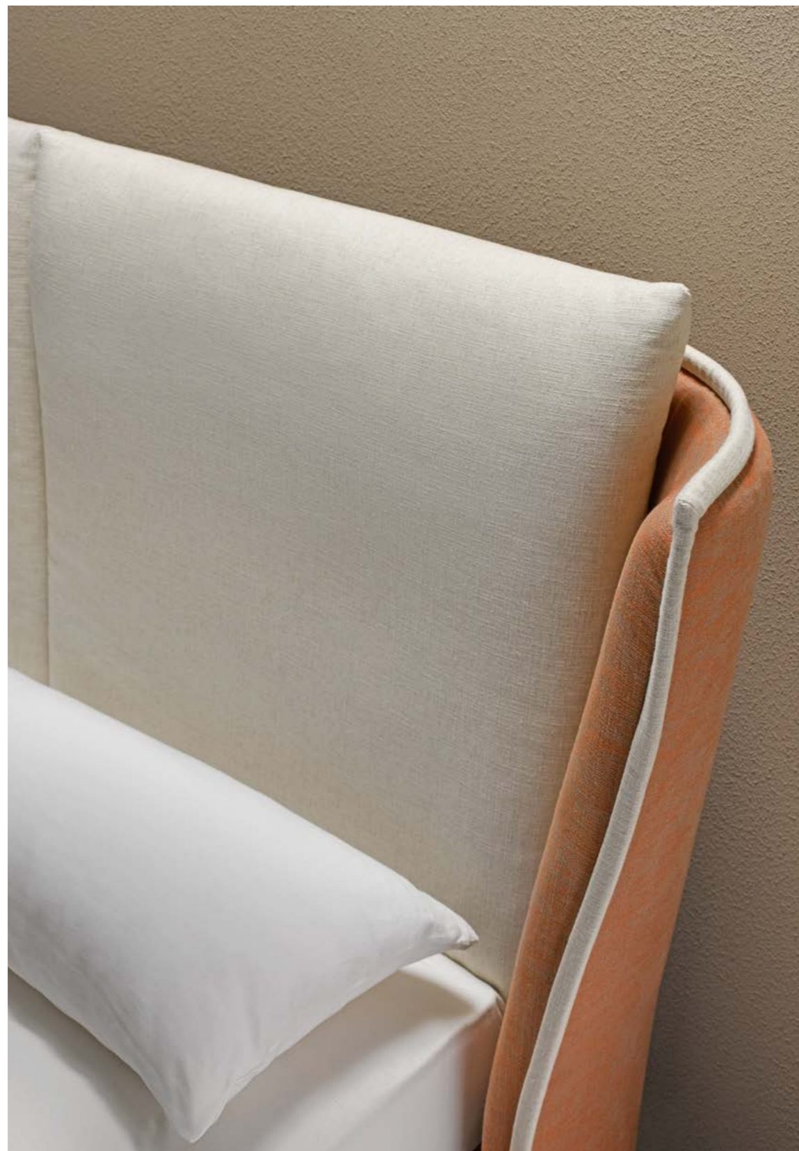
Origins Complete: Ikonisches Design und meisterhafter Schlafkomfort