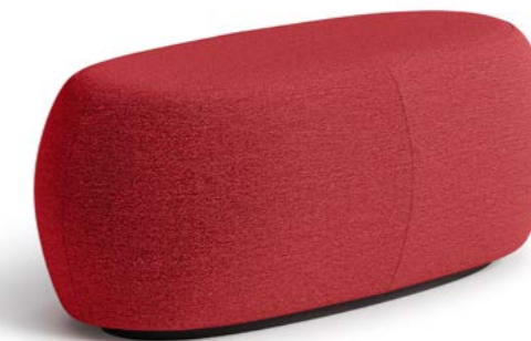
Levi - Bank - Bench