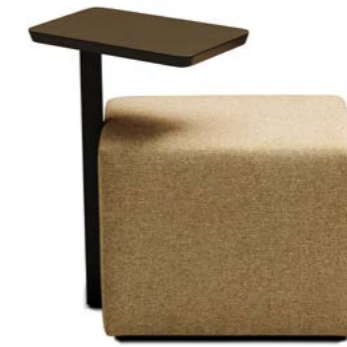
Panel - Beistelltisch mit Hocker - Side table with stool