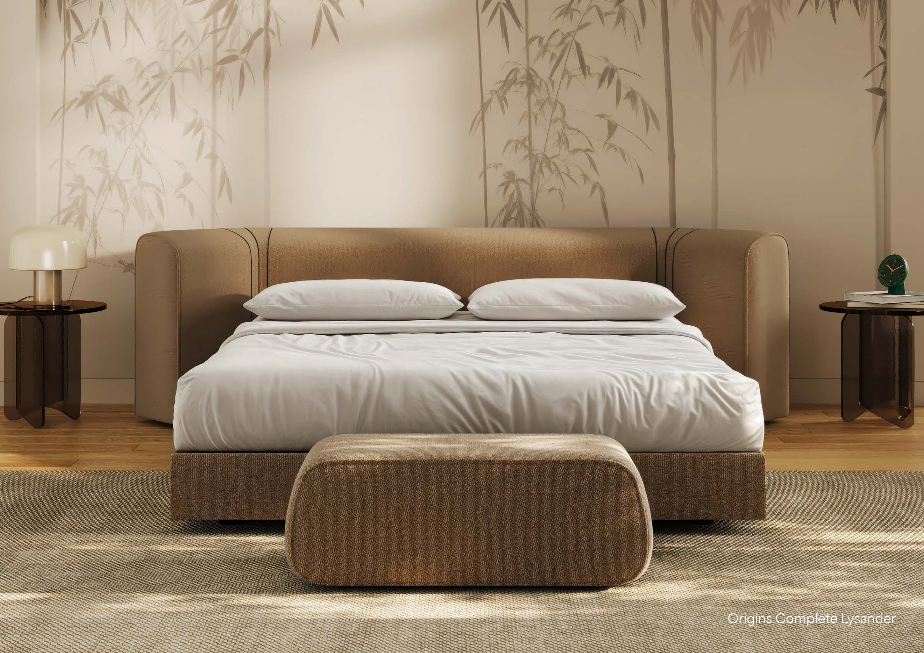
Origins Complete Lysander