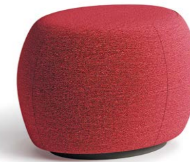
Levi - Hocker - Stool