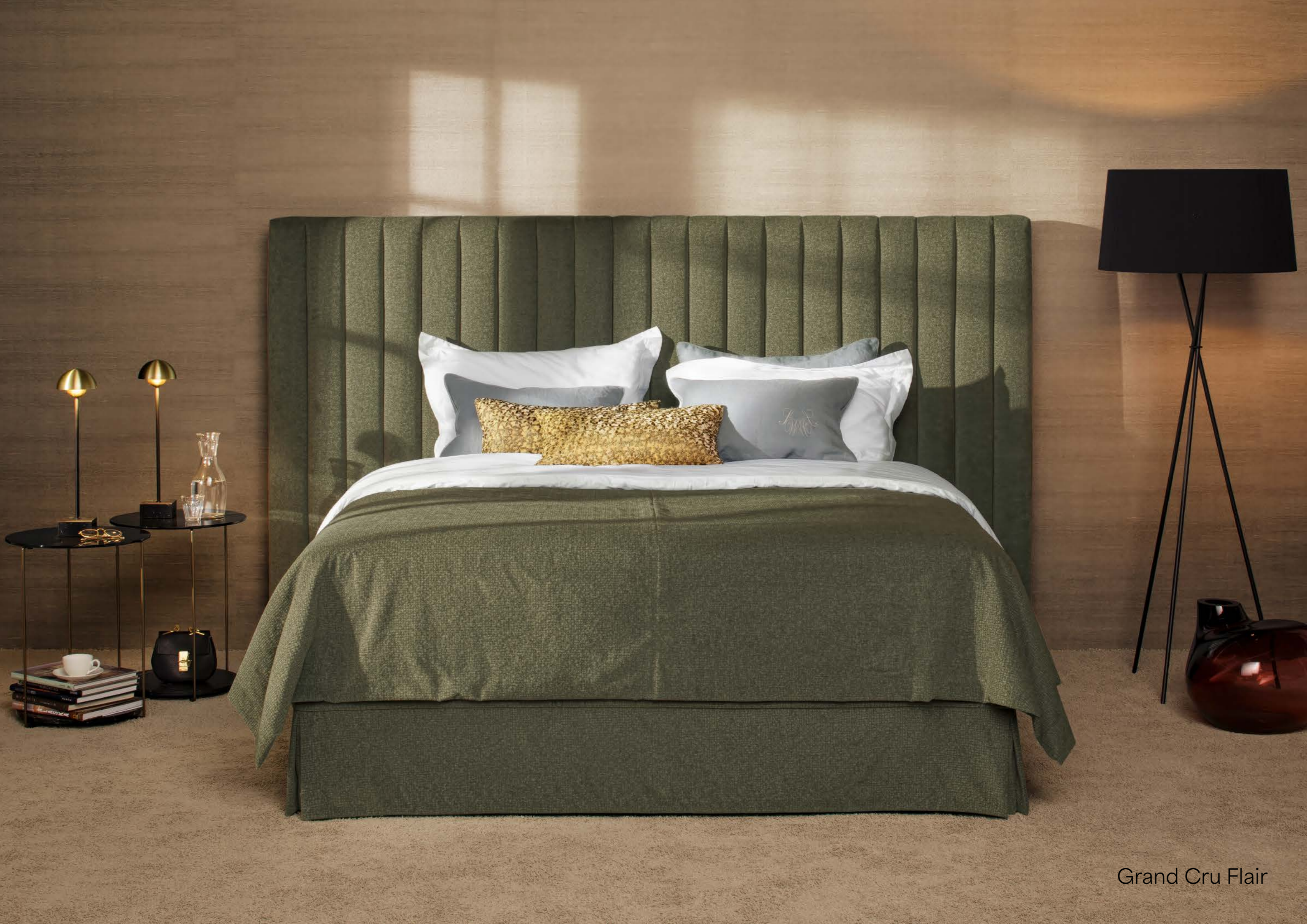
Grand Cru Flair