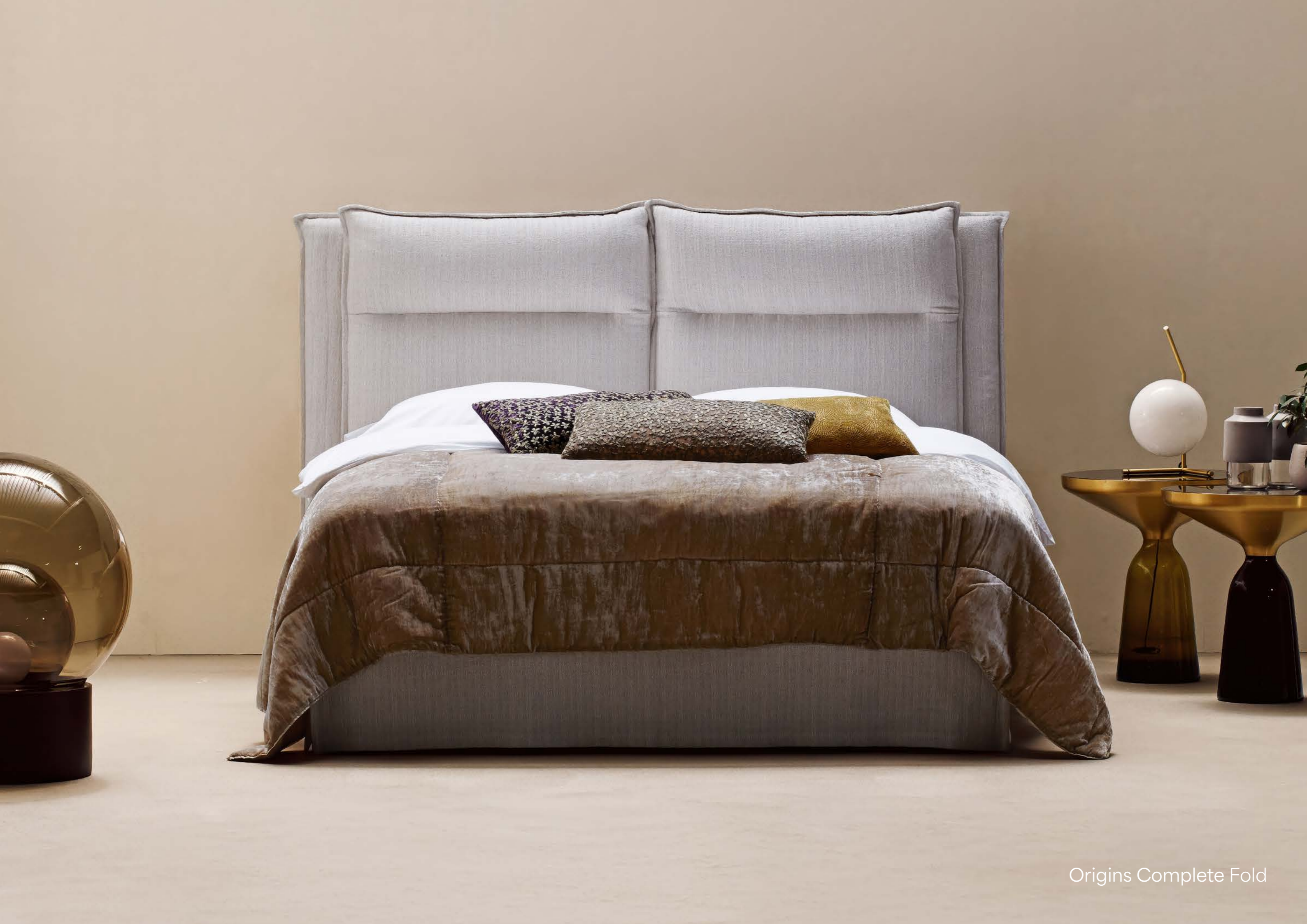
Origins Complete Fold