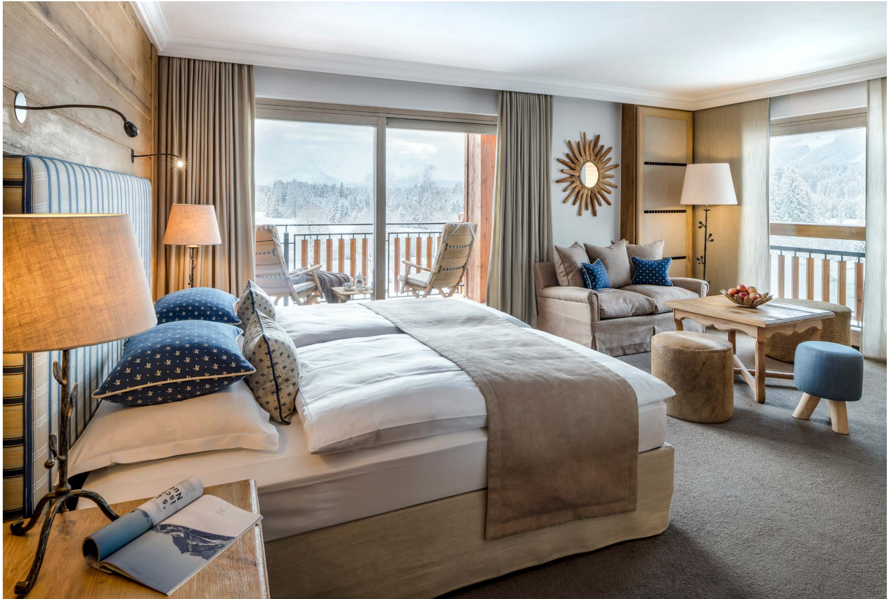
Hotel SONNENALP RESORT