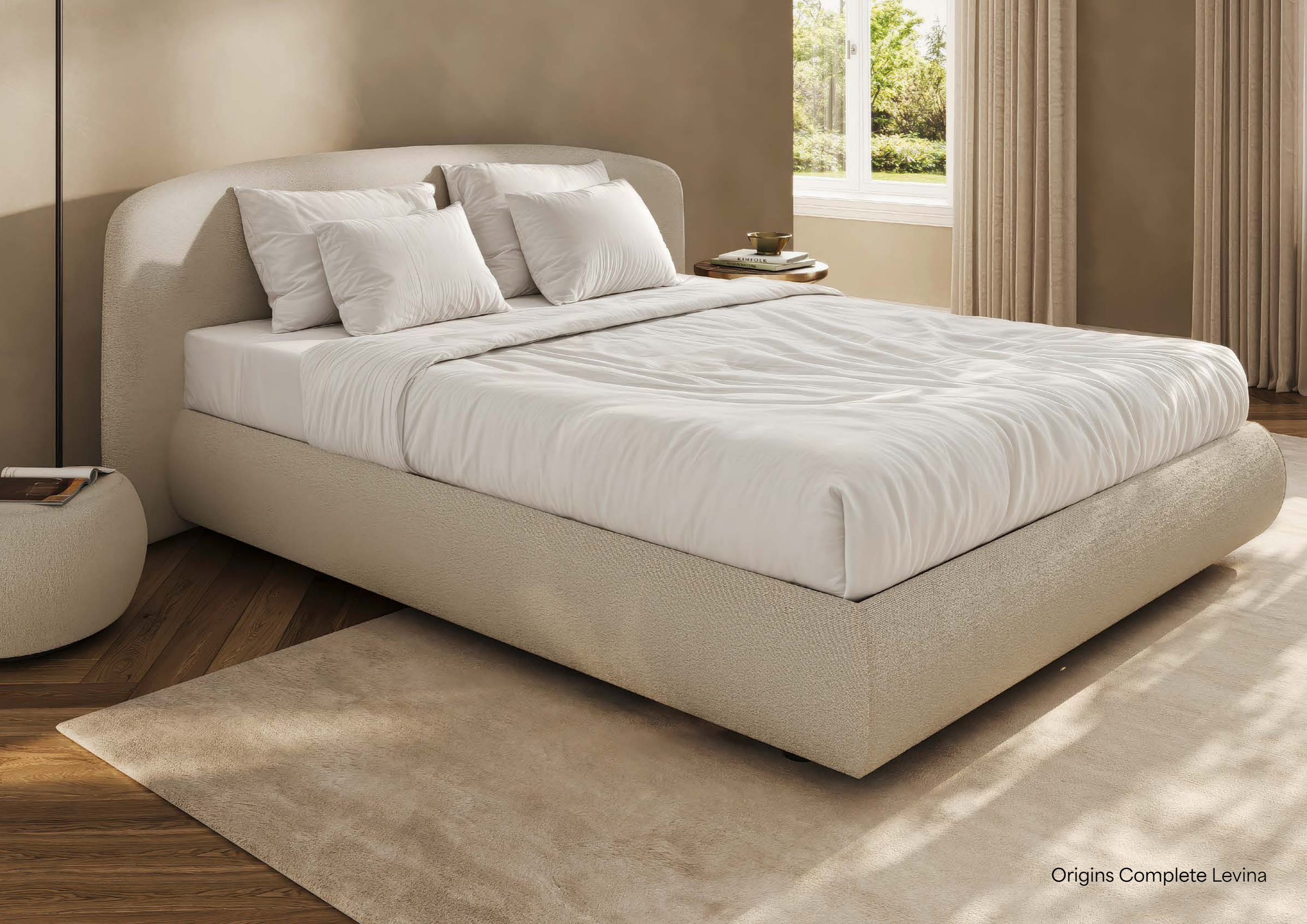
Origins Complete Levina