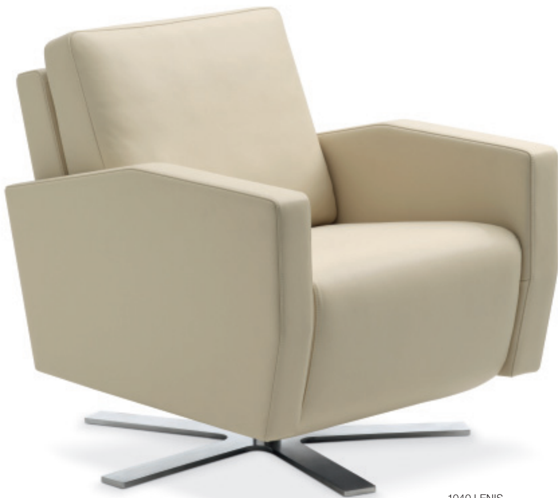
1040 LENIS Fauteuil Nevada sand, Sternfuss chrom gebürstet