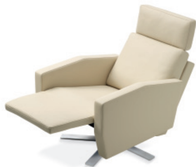
1040 LENIS Fauteuil Nevada sand, Sternfuss chrom gebürstet