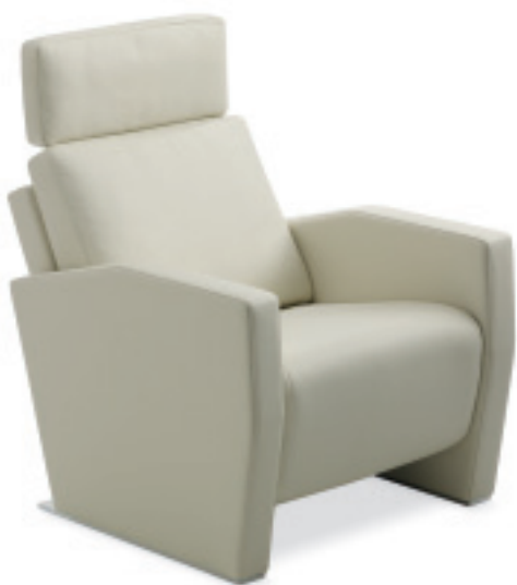
1041 LENIS Fauteuil Sierra offwhite, Kufe chrom glanz