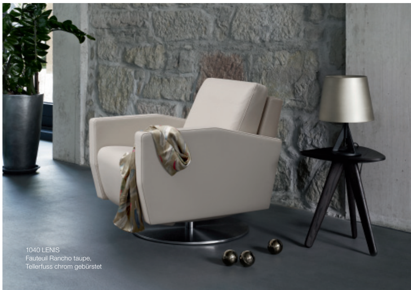
1040 LENIS Fauteuil Rancho taupe, Tellerfuss chrom gebürstet

Sichtbarer Handtaster, Alu-Optik Touches apparentes en look alu Visible manual switch in aluminium look