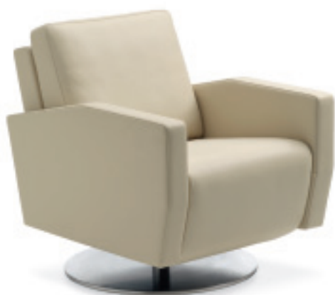
1040 LENIS Fauteuil Nevada sand, Tellerfuss chrom gebürstet