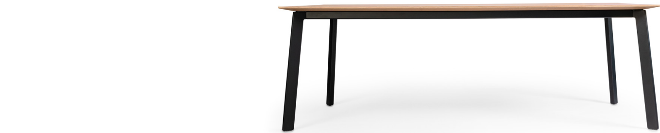
Liola Cross Design: Mathias Seiler