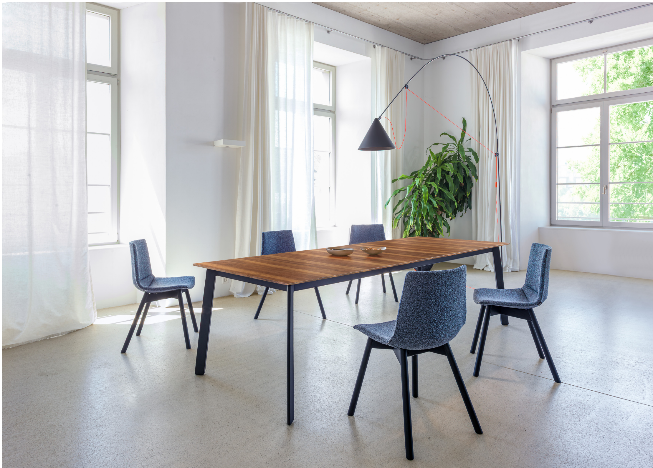
Foto oben: Liola Cross in Amerikanischem Nussbaum mit Splint, Gestellrahmen in Stahl schwarz beschichtet, Stuhl Nava mit Vollpolster linear und Holzgestell in Eiche schwarz